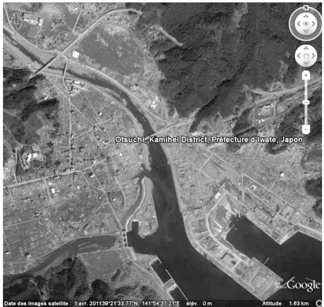
Otsuchi, avril 2011

Le web a élargi l'audience des médias classiques. Voir par exemple la série de photos « Before - After » diffusée par l'australien ABC News. Les sites web et les blogs d'experts ont complété utilement la presse traditionnelle . Rémy Scoccimarro, l'auteur d'un dossier sur « Le Japon, renouveau d'une puissance » ( Doc. photo. n° 8076, 2010 ) a rapidement développé un site spécialisé. Il a établi une excellente carte de synthèse pour recenser les effets du séisme et du tsunami (« du cataclysme à la catastrophe »). Les supports utilisés lors de deux conférences, à Toulouse et à Paris, devraient arriver prochainement en ligne. Sylvestre Huet a suivi