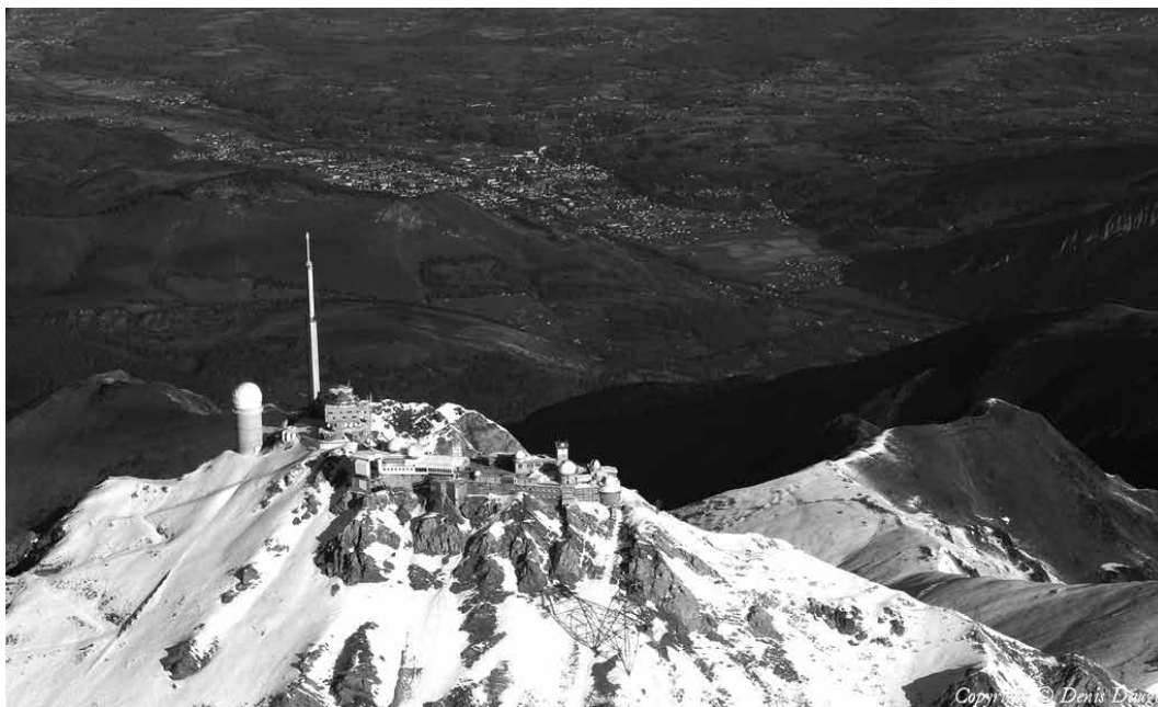
Pic du Midi-de-Bigorre - 12/2011

Les pratiques culturelles sont en rapide mutation. D'après une étude commandée par le syndicat de la librairie, la proportion des gros acheteurs de livres (dix livres par an et plus) demeure assez stable depuis 20 ans ; ils représentent à eux seuls 60 % des achats. Mais ces lecteurs ont de plus en plus intégré l'usage des écrans. Ils préfèrent le confort de l'algorithme et de la sérendipité à une proximité toujours mise en avant mais parfois absente.