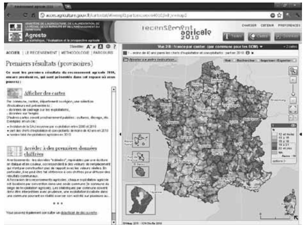
Les chefs d'exploitation agricole de moins de 40 ans - RGA 2010 - Geoclip O3 - http://franceo3.geoclip.fr/

« La nouvelle version de France découverte reprend la quasi-totalité des fonctionnalités de la version actuelle (la commande Options donne accès à la discrétisation et au choix de la gamme de couleurs), mais y ajoute un considérable gain de puissance (optimisation de la programmation, nouvelle technologie Flash/Flex, débits croissants sur Internet). Un blog accompagne cette nouvelle interface. Une démonstration en cartes et en images est à consulter en ligne. Les cartes en ligne du recensement agricole 2010. Pour Mappemonde , Denis Eckert et Laurent Jégou analysent une application de la nouvelle interface (exemple d'une carte sur « L'intensivité en main-d'œuvre du travail agricole »). Ils vantent l'efficacité technique et le respect de la sémiologie graphique mais ils redoutent les abus dans la superposition de couches externes. Ils s'étonnent de l'affichage de la Guyane sur le nord de l'Espagne. Dans sa réponse, Eric Mauvière met en avant le cahier des charges du ministère et rappelle un choix de principe : « Nous faisons pour notre part confiance à l'intelligence des utilisateurs ! » http://o3geoclip.blogspot.com/ - http://clioweb.canalblog.com/tag/o3geoclip