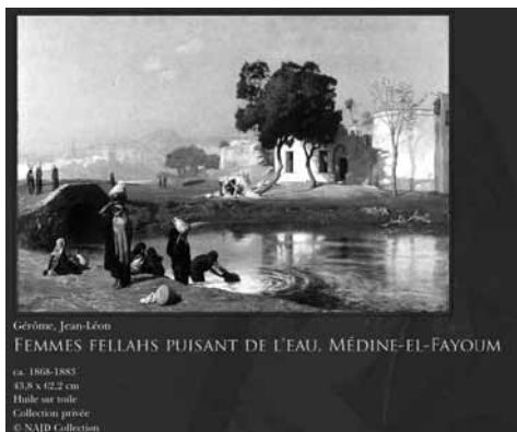
Gérôme, Jean-Léon FEMMES FELLAHS PUISANT DE L'EAU, MÉDINET-EL-FAYOUM

ca. 1868-1885 43,8 x 72,2 cm Huile sur toile Collection privée