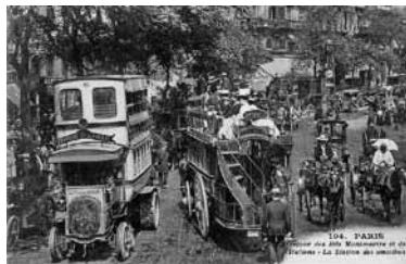
Paris - La station des omnibus Bd Montmartre-Bd des Italiens (1907-1911)

Revues.org - Roms migrants en ville (Italie, France) - Japon et Corée (1868-1970)