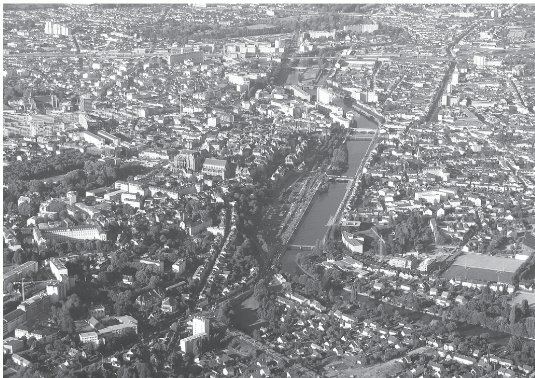
Le Mans, 09.06.2006 - http://www.survoldefrance.fr/affichage2.php?img=5708