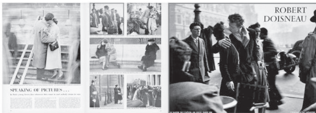
Doisneau, "Le Baiser", première publication dans Life , 1950; poster, 1986.

in André Gunther, Les icônes du photojournalisme, ou la narration visuelle inavouable - http://culturevisuelle.org/icones/2609