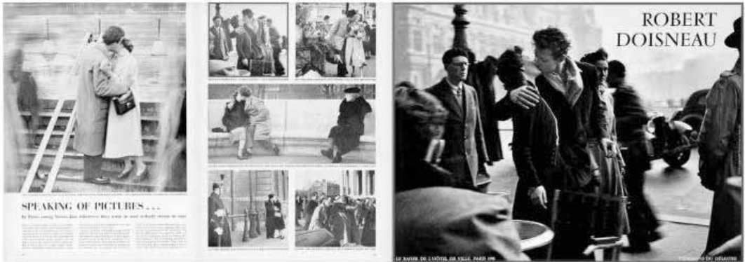
Doisneau, "Le Baiser", première publication dans Life , 1950; poster, 1986.

in André Gunther, Les icônes du photojournalisme, ou la narration visuelle inavouable - http://culturevisuelle.org/icones/2609