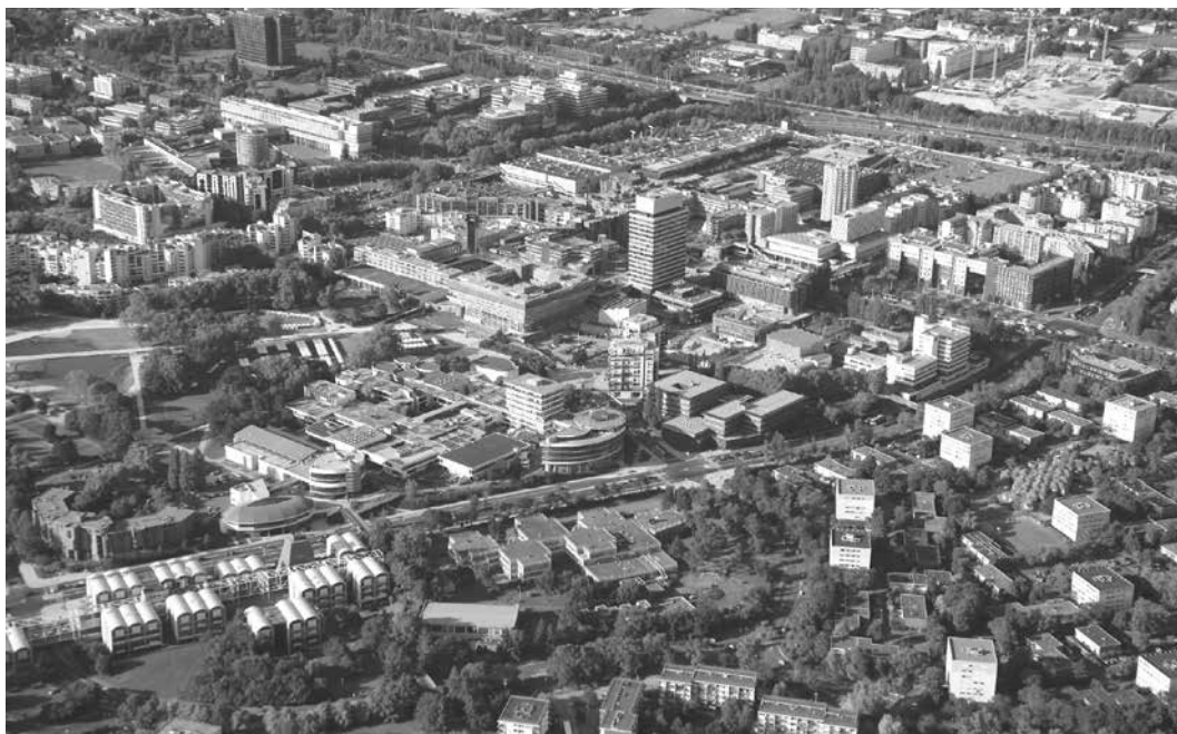
« Cergy préfecture », noyau « historique » de la ville nouvelle, en cours de rénovation.