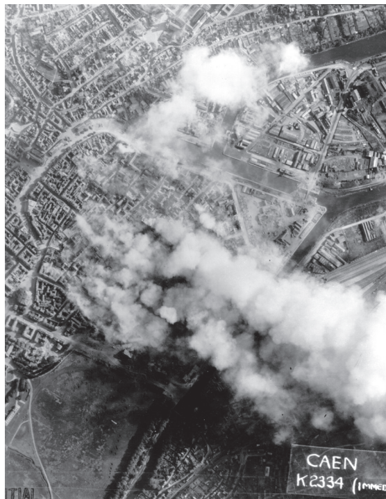
Caen juin 1944, National Archives USA p011905, PhotosNormandie https://www.flickr.com/photos/photosnormandie/tags/caen/

Les médias ont célébré le D-Day en oubliant souvent de le replacer dans le contexte global de la guerre (front russe, guerre du Pacifique). Les historiens en font le départ d'une bataille de Normandie, longue et meurtrière : Caen n'est libéré que le 9 juillet, Saint-Lô le 18 juillet, et Vire, à 80 km du littoral, le 8 août, deux mois après Arromanches, deux semaines avant Paris. Au Mémorial de Caen, un colloque a rappelé que la vision publique du débarquement est davantage influencée par le cinéma (cf. l'exemple du parachutiste de Sainte-Mère-Eglise).