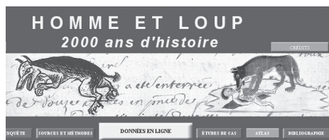
Le site web Homme et loup, 2000 ans d'histoire