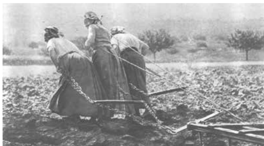
3 robustes paysannes, Lectures pour tous 1917