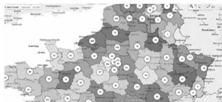
Inventaire des monuments aux morts, Lille 3 (détail) http://monumentsmorts.univ-lille3.fr/cartographie/