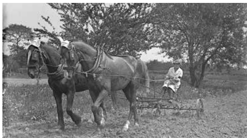
Women's Land Army, Travail de la terre avec un couple de chevaux.

« L'école n'enseigne pas à voir » affirmait Pierre Rosenberg en 2007. Un détour, avec l'aide du web, par la couverture de l'Abécédaire 14-18 (H&G 427) incite à penser le contraire. Commons reproduit la photo et en indique la source : Lectures pour tous du 15 juillet 1917. Gallica a scanné le magazine qui peut être intégralement consulté en ligne.