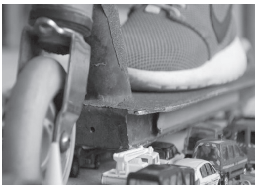
« Faisons sauter les bouchons ! » Collège J. Auriol, Boulogne-B.

- L'histgeobox : l'histoire en chansons - Les blogs de classe et les sites personnels sont très actifs. Un choix judicieux de comptes Twitter permet de suivre l'actualité de ces démarches. Ainsi, le blog histgeobox alimenté par Julien Blottière et ses collègues propose l'étude de plus de 250 chansons. « La chanson de Craonne », « L'affiche rouge », « La tondué », « Le déserteur » figurent parmi les titres les plus consultés récemment. http://lhistgeobox.blogspot.fr/