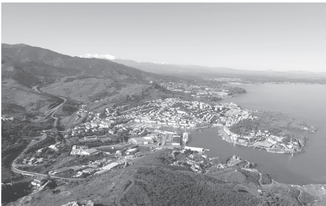
Port-Vendres