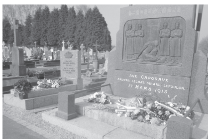
Les caporaux de Souain - Sartilly 17 mars 2015

Sartilly, Le Ferré, Le Chefresne, Suippes commémorent le souvenir des quatre caporaux de Souain fusillés le 17 mars 1915 et réhabilités le 3 mars 1934. Plusieurs raisons incitent à mettre en avant Théophile Maupas, Lucien Lechat, Louis Girard et Louis Lefoulon : à travers ces destins brisés par la « justice » militaire, il est possible d'incarner le sort des 9 millions d'hommes tués dans une guerre entre puissances européennes. Leur réhabilitation a été obtenue par Blanche Maupas, à la suite d'un combat long et déterminé (cf. Le Fusillé , l'ouvrage qu'elle a publié en 1933) ; les archives numérisées sont disponibles en ligne depuis quelques mois. En 1994, un livre de l'institutrice Jacqueline Laisné a rappelé le sort de ces fusillés ainsi que le soutien apporté par les populations locales à leur cause. Enfin, l'historien est armé pour distinguer histoire et mémoires, pour observer les cérémonies de 2015, organisées en liaison avec le centenaire, pour participer aux débats qui accompagnent la mise en perspective de cette histoire par le cinéma et la littérature. http://clioweb.canalblog.com/tag/maupas